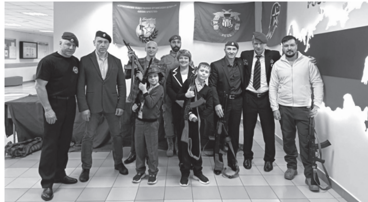
Команда «Боевого братства» проводит уроки мужества в школах Ленобласти

— Нам удалось собрать более 5 тыс. подарков. Это стало не просто региональной акцией, а все-