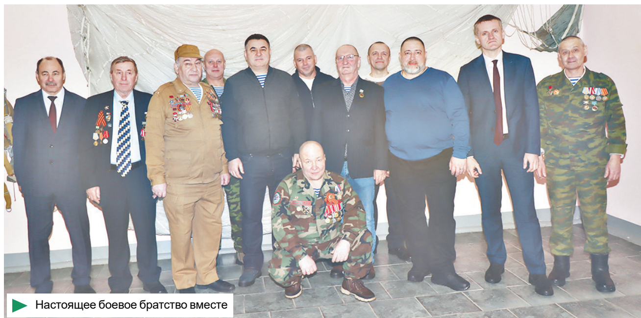
Настоящее боевое братство вместе

Для каждого гражданина страны, чьё сердце наполнено любовью к своему Отечеству, афганцы навсегда останутся примером смелости и самоотверженности.