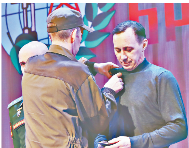
В одном строю: бойцы СВО получили нагрудные знаки от Союза ветеранов Афганистана