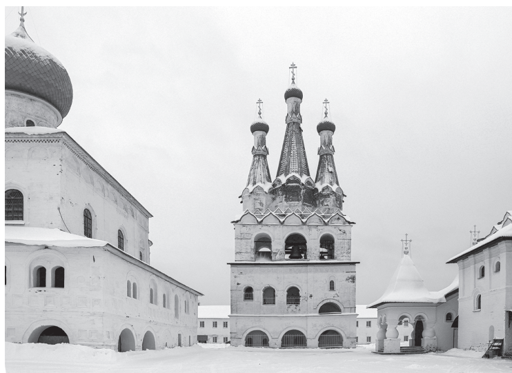
Александро-Свирский монастырь известен памятниками архитектуры XVI века