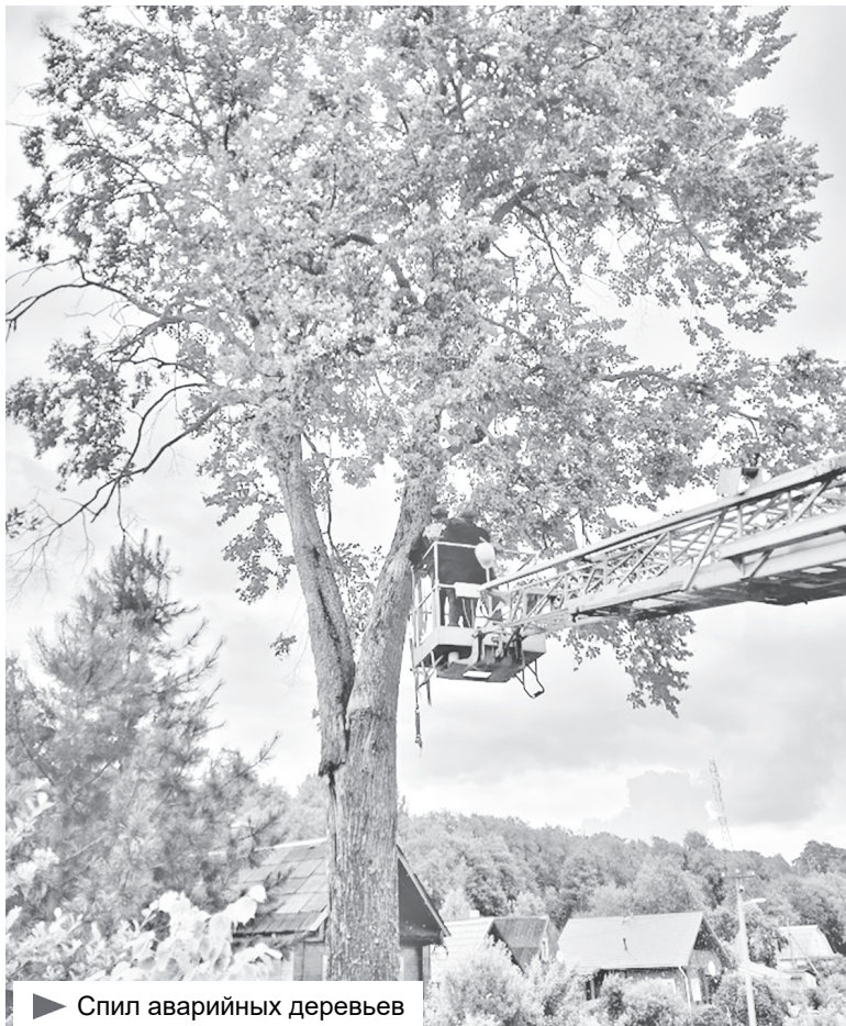
▶ Спил аварийных деревьев

предпринимательства, все они индивидуальные предприниматели. Основной вид деятельности новых субъектов – торговля и грузоперевозки. Большую помощь предпринимателям оказывает Подпорожский фонд развития экономики и предпринимательства «Центр делового сотрудничества».