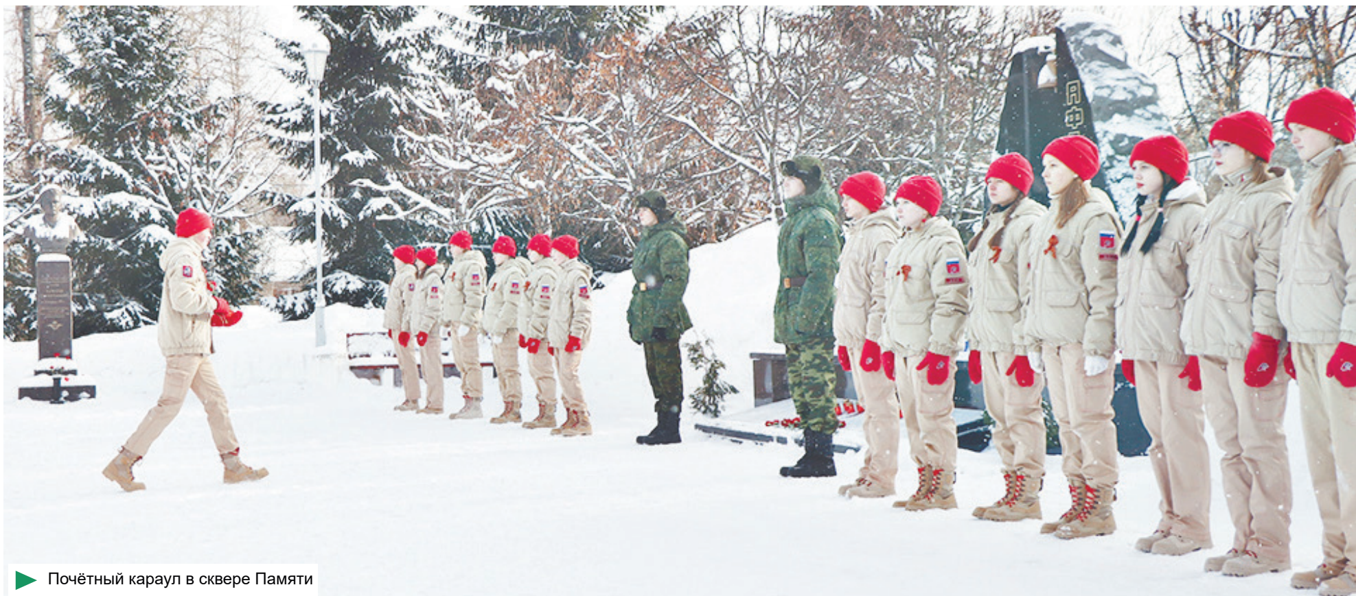
► Почётный караул в сквере Памяти