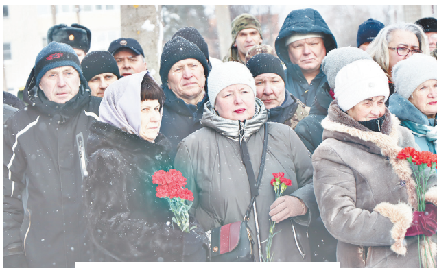
► Помним, скорбим, гордимся

15 ФЕВРАЛЯ В СКВЕРЕ ПАМЯТИ У ГОРОДСКОГО ВОЕНКОМАТ ПРОШЛО ТОРЖЕСТВЕННО-ТРАУРНОЕ МЕРОПРИЯТИЕ ПОД НАЗВАНИЕМ «ПАМЯТЬ ВОЗВРАЩАЕТ НАС...», ПОСВЯЩЁННОЕ ДНЮ ПАМЯТИ О РОССИЯНАХ, ИСПОЛНЯВШИХ СЛУЖЕБНЫЙ ДОЛГ ЗА ПРЕДЕЛАМИ ОТЕЧЕСТВА И 35-Й ГОДОВЩИНЕ ВЫВОДА СОВЕТСКИХ ВОЙСК ИЗ АФГАНИСТАНА.