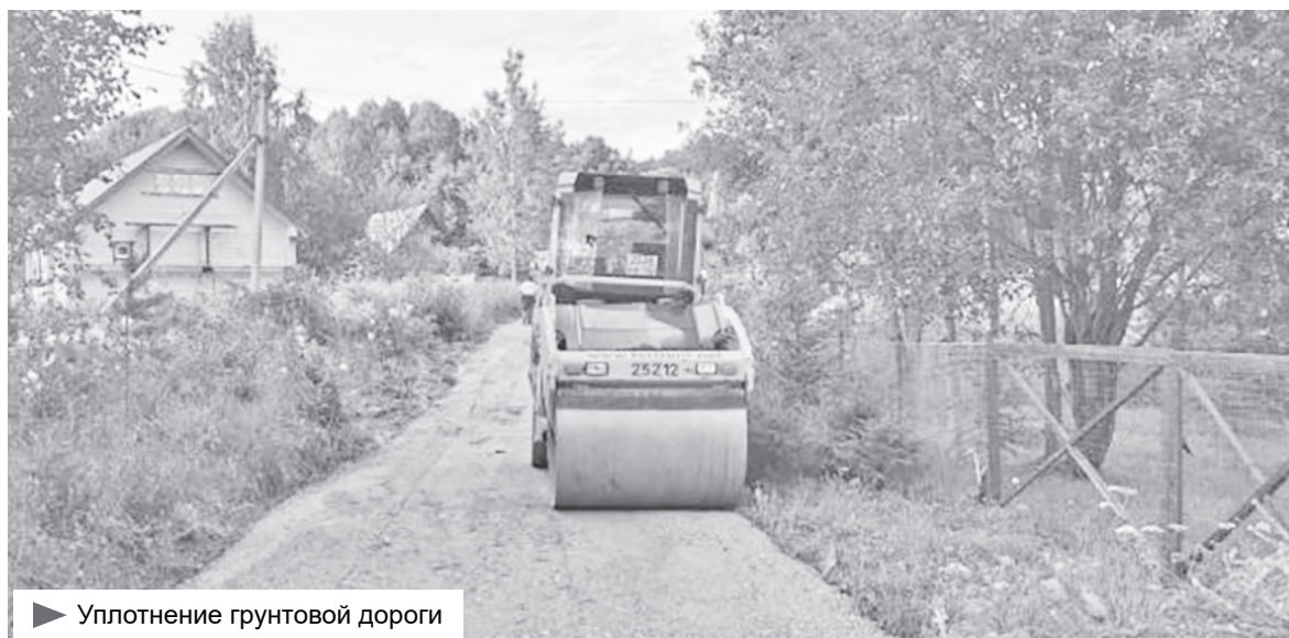
► Уплотнение грунтовой дороги

На территории Важинского городского поселения зарегистрировано 65 субъектов малого и среднего предпринимательства, из них 51 индивидуальный предприниматель, 14 юридических лиц. В 2023 году вновь создано 16 субъектов малого и среднего