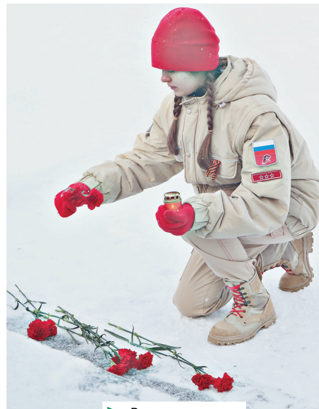
► Возложение цветов

35 лет назад завершился вывод ограниченного контингента советских войск из Афганистана. 40-я армия с развёрнутыми боевыми знамёнами вернулась на Родину. Те, кто воевал там, в чужих горах, понимали одно – они воюют за свою страну, защищают южную границу СССР, выполняют приказ своей Родины. Через горнило Афганской войны прошли более 620 тысяч человек, и среди них были наши земляки.