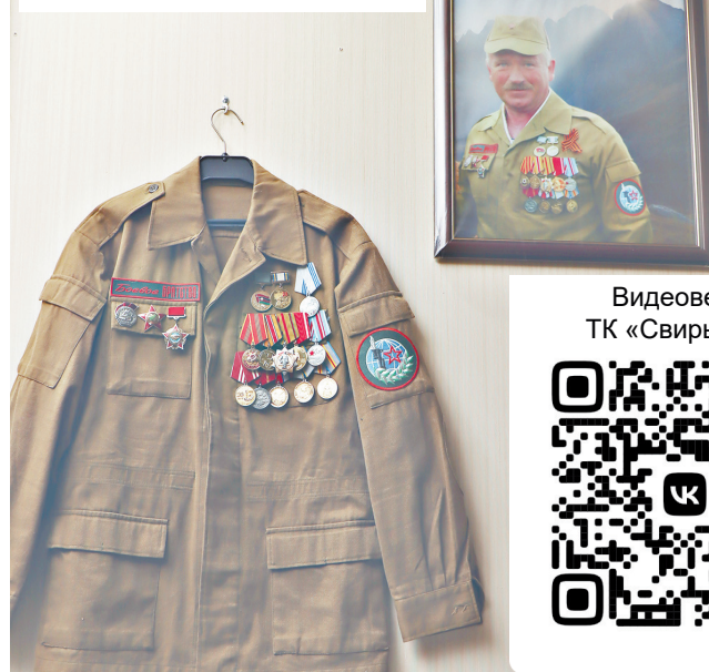
Видеверсия ТК «СвирьИнфо»