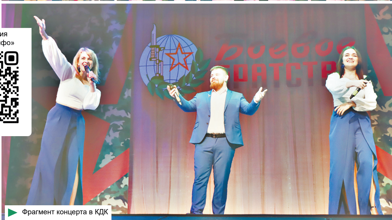
Фрагмент концерта в КДК