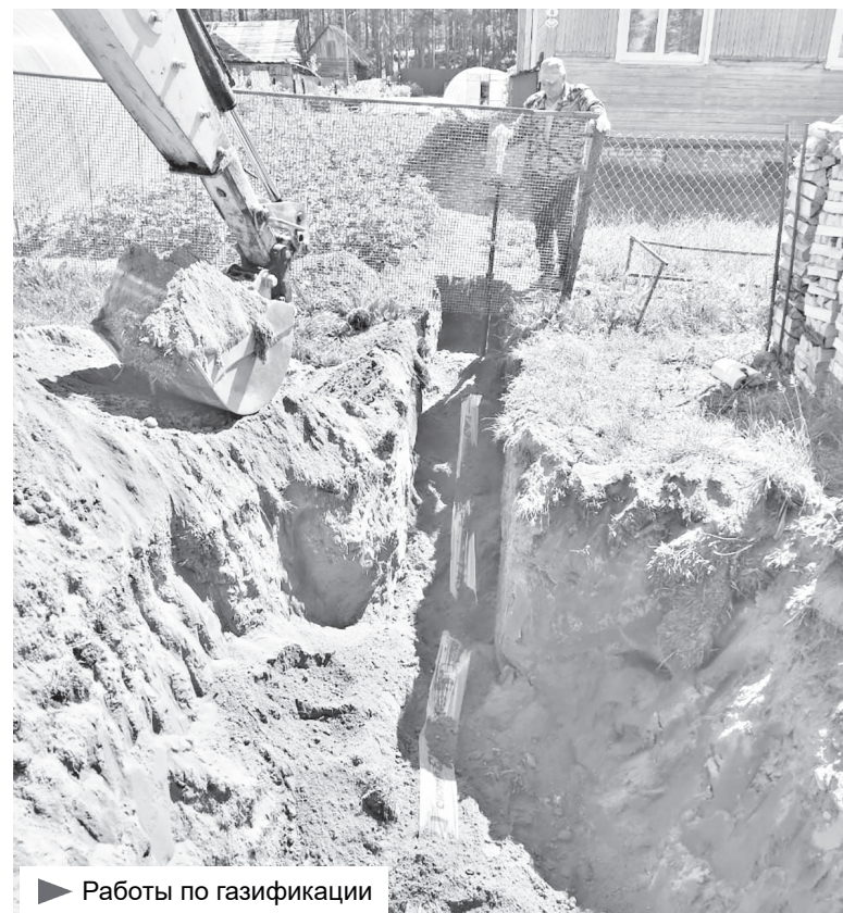
▶ Работы по газификации