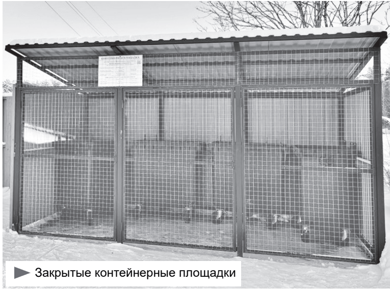
▶ Закрытые контейнерные площадки

– На обращение администрации ГУП «Леноблводоканал» ответил, что не сможет выполнить в 2023 году ремонт фасада КНС и благоустройство земельного