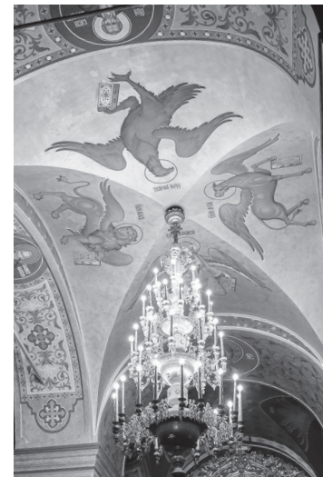
Внутреннее убранство одного из храмов монастыря

Но причём здесь Фиваида? Дело в том, что на заре утверждения христианства состоялся «великий исход» отшельников в египетскую пустыню, где постепенно сложилась своего рода зона расселения святых от-