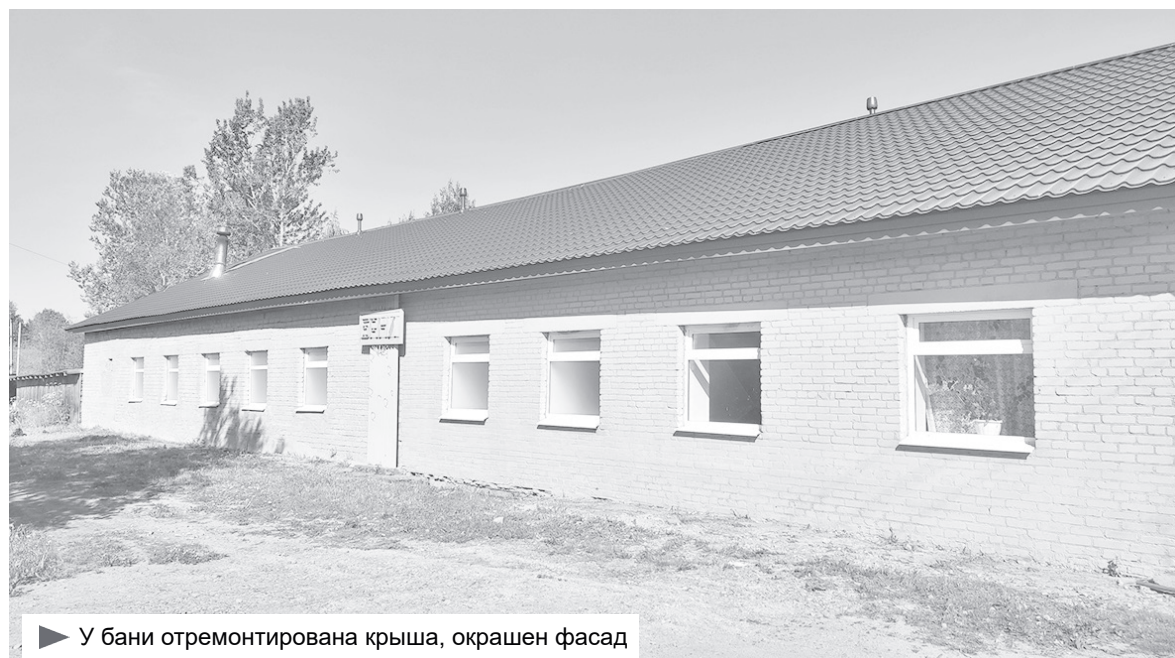
► У бани отремонтирована крыша, окрашен фасад

Какие же изменения произошли за 2023 год в социально-экономической жизни Важинского поселения? Начнём с того, что с 1 января 2023 года общая числен-